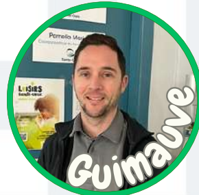
Directeur des Loisirs