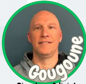
Directeur Adjoint des Loisirs