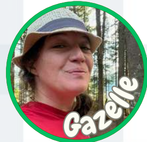
Coordonnatrice des Loisirs